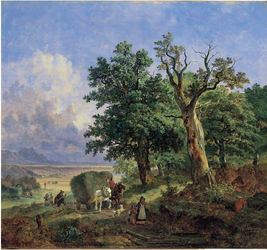
Abb. 4: Heinrich Bürkel: Heuernte (1839) 32

Auf den ersten Blick schon kann man die Verwandtschaft mit dem Stich von Salomon Gessner erkennen (Abb. 3). Die Figuren sind klein, die Natur übermächtig. Romantischer Wald dominiert noch über Ackerkultur. Aber die Figuren sind keine idealisierten Gestalten mehr, sondern Bauern. Sie sind sogar bei der Arbeit, wenngleich sie nicht überanstrengt wirken. Man sieht sie aus der Ferne gleichsam mit dem touristischen Blick des unbeteiligten Städters.