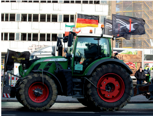
Abb. 3 Bauernprotest in Berlin, 26.01.2021

Erkennungszeichen in aktuellen Bauernprotesten. 8 Als am 28. Januar 2021 Landwirte Berlin-Mitte blockierten (Abb. 3), nannte die damals