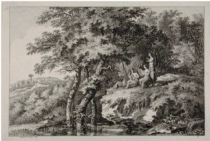
Abb. 3: Salomon Gessner: Bukolische Szene (1767) 16

Seine Idyllen beschreibt Gessner, der auch bildender Künstler war, als „die Früchte [dieser] Stunden“ (ebd.). Diesen Zugang kann mit einem Werk von Gessner selbst illustrieren: