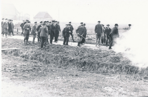
Abb. 2 „Ochsenfeuer“ in Beidenfleth als Protest gegen eine Viehpfändung

und Tieren beantworteten diese Bauernführer mit Aufrufen zum Steuerboykott und einige mit militanten Aktionen, bei denen Bomben auf staatliche Gebäude geworfen wurden. Von Mai bis September 1929 wurden allein 13 Sprengstoffanschläge verübt. Historisch stellte sich die Landvolkbewegung, die am 28. Januar 1928 allein in Heide (Holstein) 14.000 Landwirte auf die Straße brachte 5 , in die Tradition der Bauernkriege des 16. Jahrhunderts. Gerieten zwi-