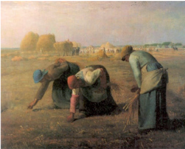
Abb. 1: Jean-François Millet: Les Glaneuses (1857) 9

Um diesen Kontext zu illustrieren, sei ein Beispiel zeitgenössischer Landschaftsmalerei eingefügt: die Ährenleserinnen von Jean-François Millet (1814–1875) aus dem Jahr 1857.