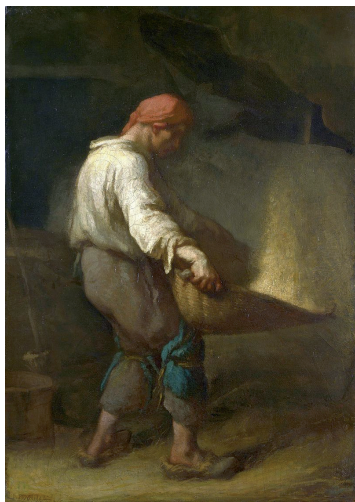
Abb. 2: Jean-François Millet: Un vanneur (1848) 11

Selbst aus dem Milieu wohlhabender Bauern gebürtig, hatte sich Millet zunächst erfolglos in der Aneignung konventioneller Sujets wie mythologischer Szenen versucht, ehe er auf die Idee kam, das zu malen, was er aus eigener Anschauung kannte. Sein Kornschwinger aus dem Jahr 1848 war das erste dieser Reihe und erregte große Aufmerksamkeit. Zusammen mit seinem Kollegen Gustave Courbet gilt er darum als Wegbereiter des Realismus in der Malerei. 10